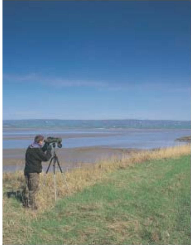
Gwyllo adar ar ran uchaf Hafren (Slimbridge)

Lle bynnag y bydd yn bosibl bydd y gweithgareddau a nodir yn seiliedig ar y dull gwirfoddol yn y lle cyntaf, yn cynnwys cydweithredu a chonsensws eang rhwng sefydliadau. O ran Egwyddor 6 y Ddogfen Sylfaen, bydd is-ddeddfau ychwanegol ond yn cael eu cyflwyno i'r cynllun rheoli pan fydd dulliau gwirfoddol yn annigonol, pan fydd pob dewis arall wedi ei ystyried ac mai dyma'r unig ateb effeithiol.