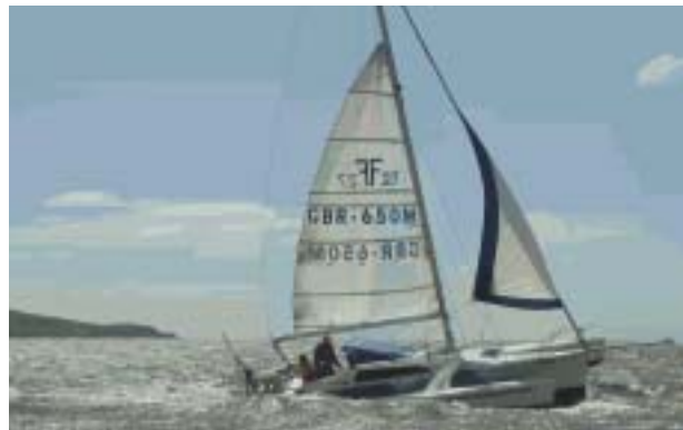
Rasio iotiau ar Afon Hafren

Mae'r Cynllun Gweithredu'n cynnwys gweithgareddau i'w hysgwyddo gan swyddog gweithredu'r cynllun rheoli. Mae'r rhain yn cynnwys cydlynu llunio canllaw fframwaith ar gyfer rhai