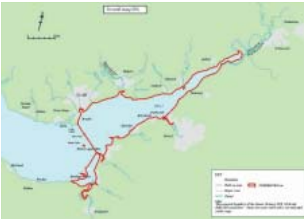
Severn Estuary Special Protection Area (SPA)

Yn seiliedig ar Reoliad 34 (1) y Conservation (Natural Habitats & c.) Regulations 1994 a chyfansoddiad ASERA