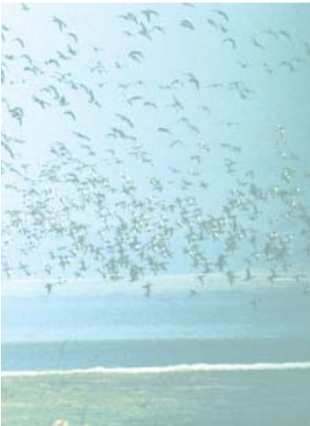
Chwiw ym Mae Bridgewater

Mae Môr Hafren yn cefnogi poblogaethau o adar gwyllt sydd o bwysigrwydd Ewropeaidd, ac er mwyn cydnabod hyn, pennwyd y Môr yn Ardal Gwarchod Arbennig (SPA) yn 1995. Mae Môr Hafren hefyd yn safle Ramsar ac yn Ardal Cadwraeth Arbennig bosibl (pSAC). Am ragor o wybodaeth ar y disgrifiad o'r safle a rhesymau am y dynodiad, gweler pennod 4 o'r cynllun rheoli.