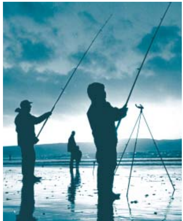
Pysgota o'r lan yn Weston-Super-Mare

Nid yw'r gweithgareddau hyn o reidrwydd yn effeithio ar y safle cyfan. Mae amseru, dwysedd a natur y gweithgareddau hyn yn amrywio ar draws y safle ac o ganlyniad bydd unrhyw ddirywiad, neu aflonyddwch posibl a achosir ganddynt hefyd yn amrywio ar draws y safle. Bydd casglu gwybodaeth bellach ynghylch y gweithgareddau hyn yn hysbysu barn ynghylch eu heffeithiau tebygol. Yn ogystal, gall arweiniad ar arfer gorau ar gyfer gweithredu a rheoli rhai o'r gweithgareddau hyn helpu i filwriaethu yn erbyn unrhyw effeithiau y gallent fod yn eu cael.