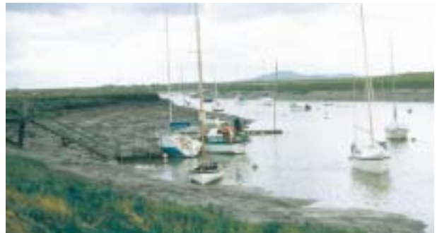
Angorfeydd iot ar Afon Axe

Mewn rhai achosion pan fydd mwy nag un awdurdod yn gyfrifol am reoli gweithgaredd lle ceir effaith hysbys neu anhysbys ar y safle, neu lle ceir bylchau mewn rheolaeth, mae awdurdodau perthnasol wedi cytuno i weithio'n gydweithredol i fynd i'r afael â'r materion. Bydd dull partneriaeth yn cael ei sicrhau drwy sefydlu grwpiau testun, ac os yn briodol, gellir gwahodd aelodau Grŵp Ymgynghorol neu sefydliadau perthnasol eraill i gymryd rhan. Yna, ceir trafodaethau er mwyn pennu gweithgareddau ac atebion rheoli posibl.